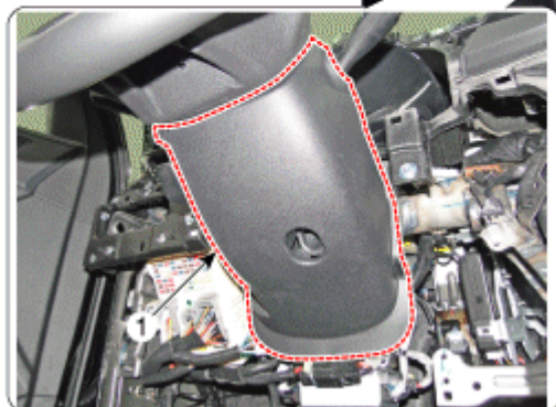
1. 转向柱护罩下装饰板